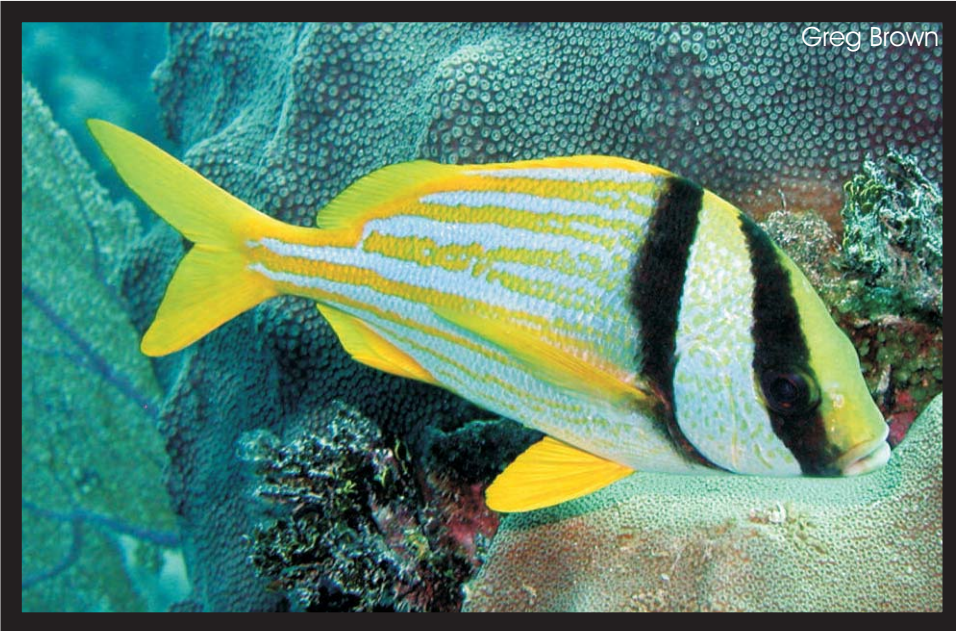
Burro Payaso Porkfish Anisotremus virginicus