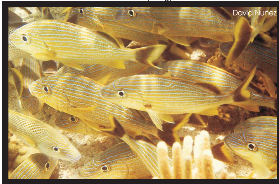
Ronco Catire Bluestripe Grunt Haemulon sciurus