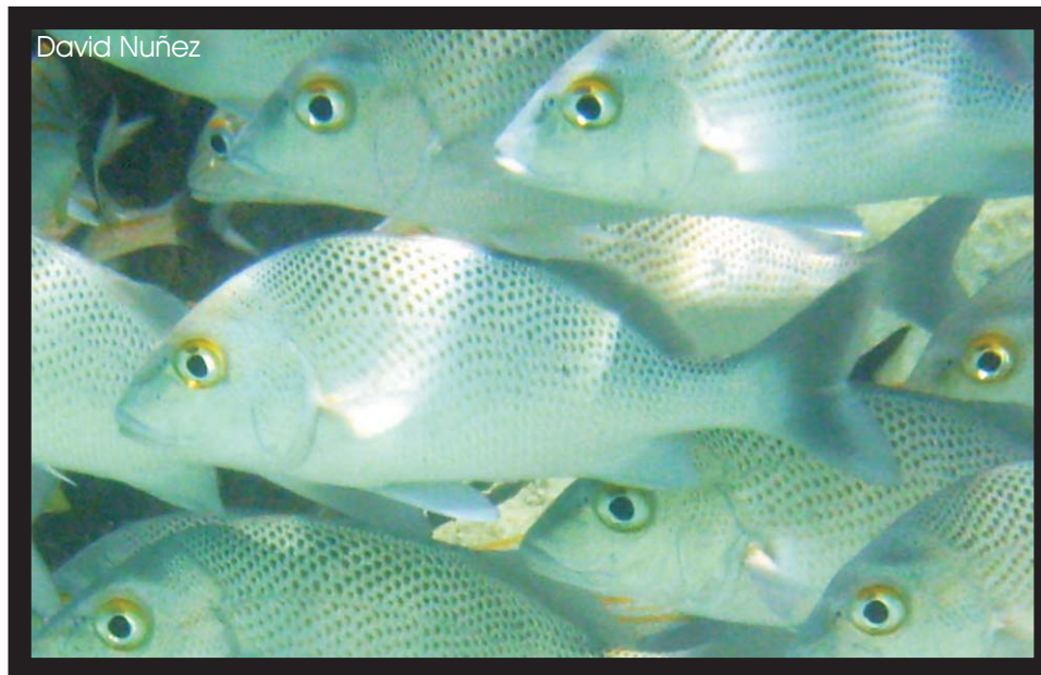
Ronco Plateado Sailor's Choice Haemulon parra